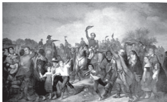
MOREAUX, F. R. Proclamação da Independência.